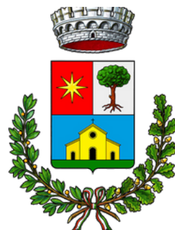
Comune di Cadorago