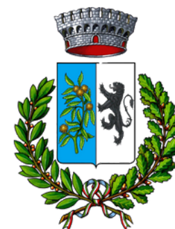
Comune di Casnate con Bernate